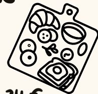
Planche sucré et salé - 24 €

galette jambon/fromage, oeuf sur le plat, charcuteries ibériques, fromages, salade et crudités, pain aux céréales, fromage blanc aux mueslis et fruits frais, mignardises maison, une boisson froide (bière lager ou verre de vin ou soda ou jus de fruit) et une boisson chaude (café ou thé ou chocolat chaud)